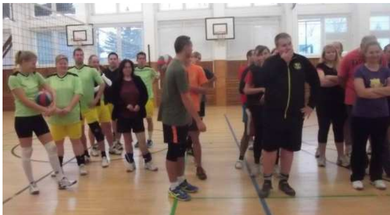
Z ranního nástupu