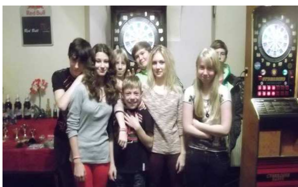
Všichni dětsí účastníci