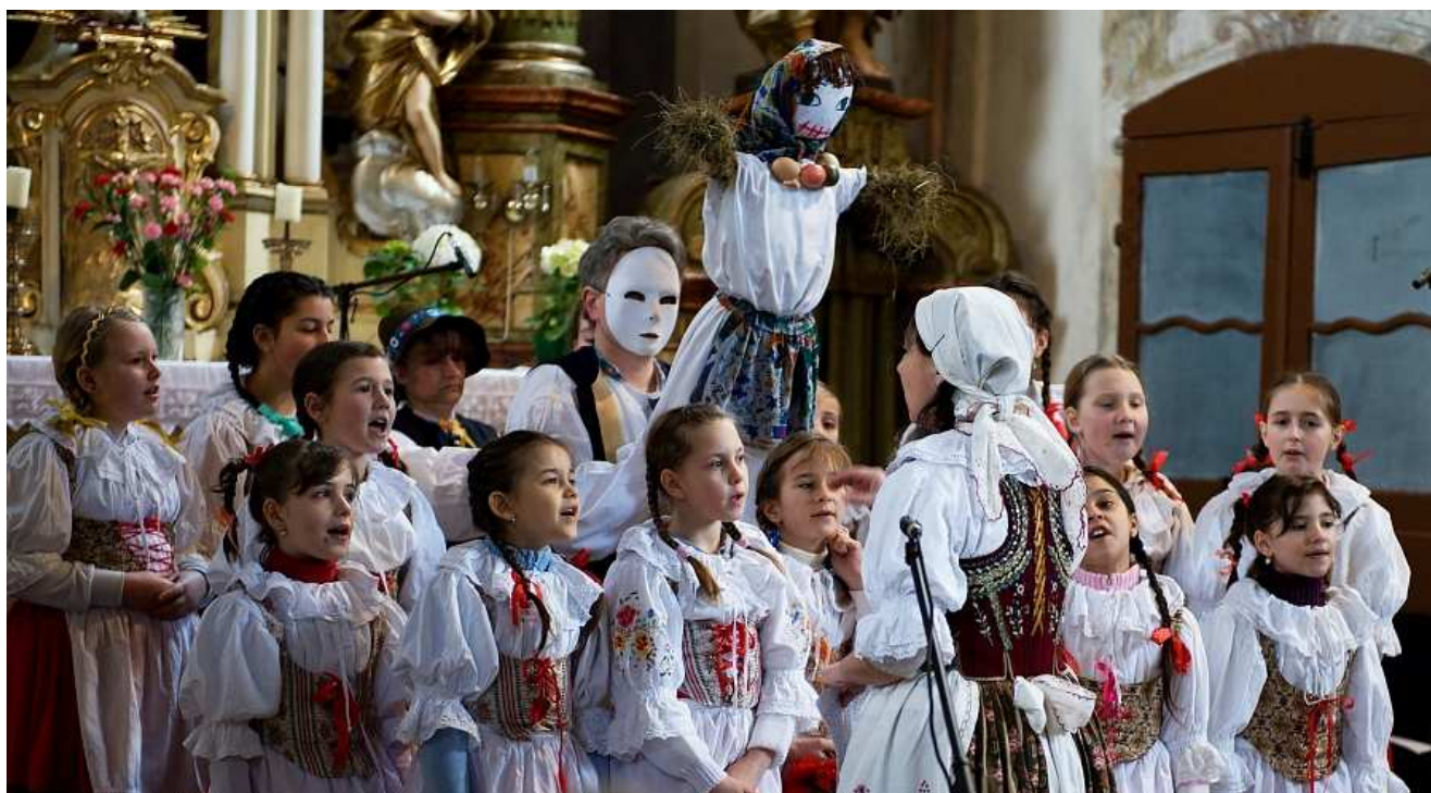
13. 4. Jarní koncert v kostele sv. Petra a Pavla