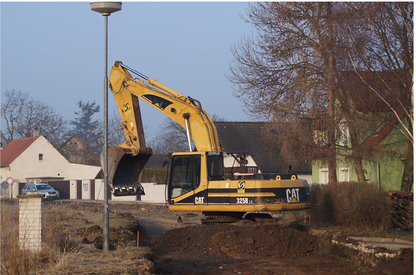
Rekonstrukce Wintřovy ulice