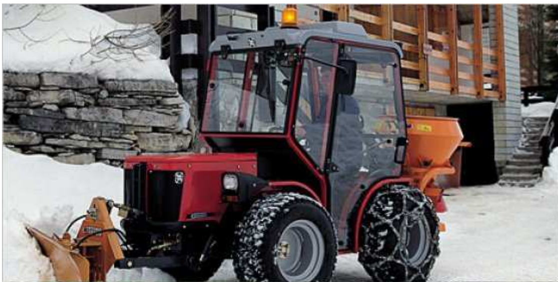
Ilustrativní foto nového traktoru Antonio Carraro TTR 4400 HST CAB

V rámci rozhodnutí o pořízení nové technologie se rada rozhodla vypsát výběrové řízení na obsluhu zmíněné techniky s předpokládaným nástupem ve 3., popř. ve 4. kalendářním měsíci. Podmínky výběrového řízení budou uveřejněny na webových stránkách města a dále i na úřední desce.