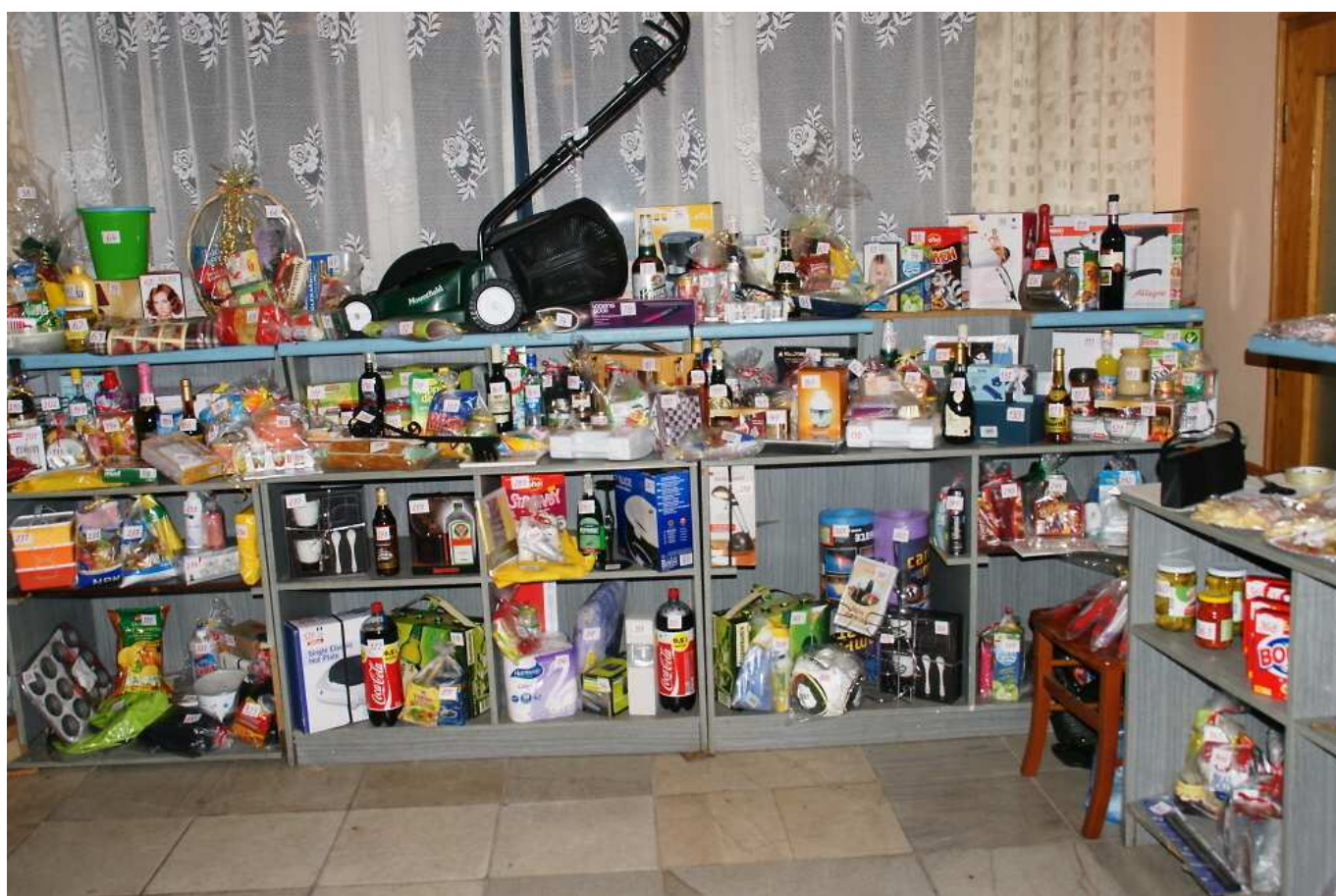
Tombola městského plesu