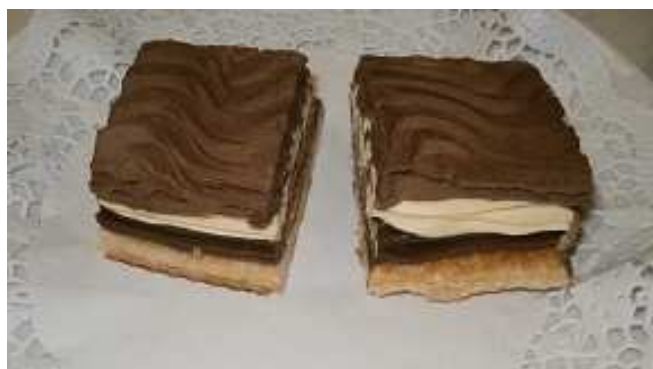
Nová Regionální potravina má výjimečnou chladivou chuť.