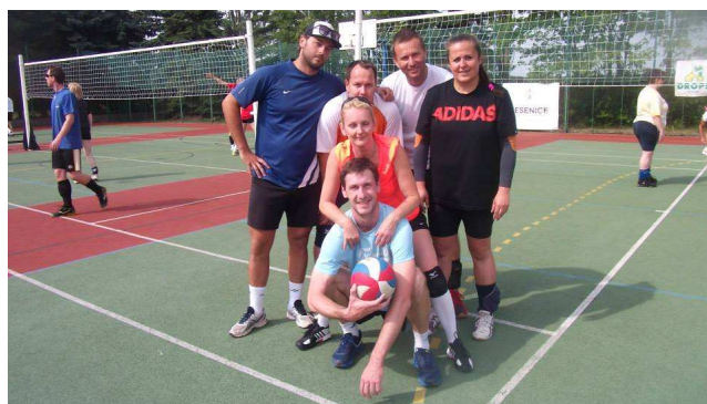
vítězný tým CHLUPATÝ KAKTUS LOUNY

Slavnostní předání cen proběhlo jako již tradičně v Kulturním domě v Jesenici, kde poté zahrála též tradičně kapela IFA Rock. Na závěr jen pár slov. Celý turnaj proběhl v přátelské atmosféře, nebyl podán žádný protest, a pokud je mi známo, nedošlo ani k žádnému většímu zranění. Všichni sportovci byli vzorní i co se týká pořádku – to se pozná především druhý den, kdy se po turnaji uklízí.