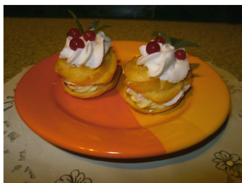
2. místo Rybízový oválek