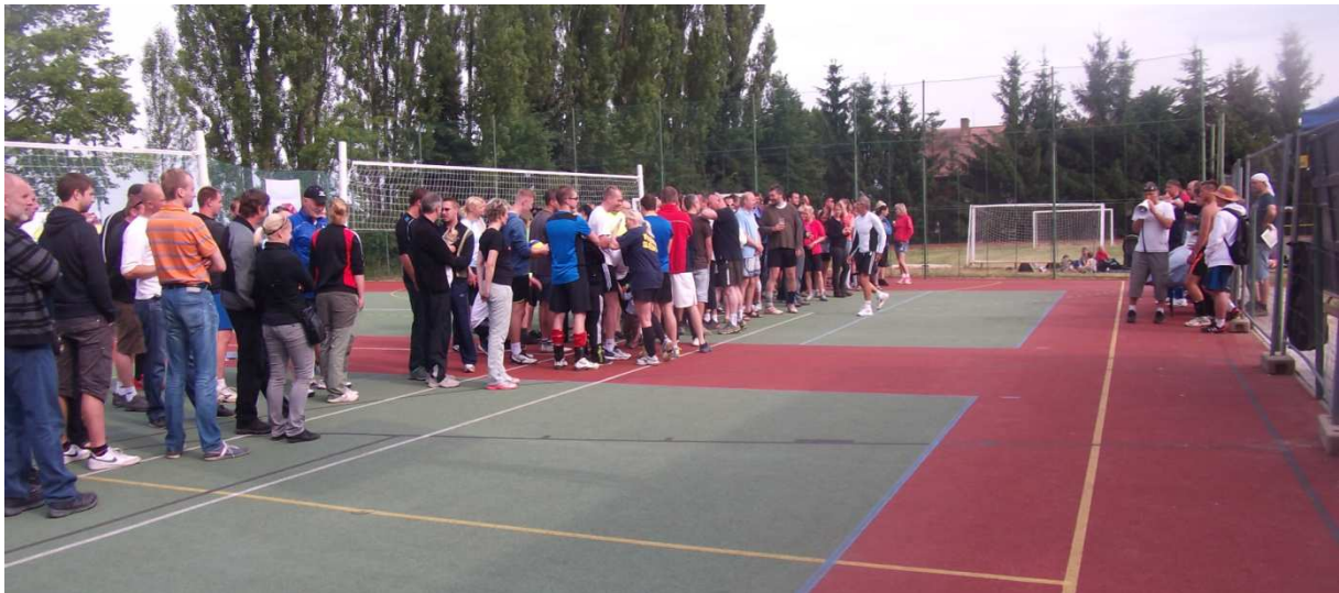
Fotka z ranního nástupu

V sobotu 28. června 2014 se uskutečnil jubilejní X. ročník volejbalového turnaje smíšených družstev „O Jesenický KVAKpohár“. Protože celá škola a přilehlé okolí prochází v současnosti rozsáhlou rekonstrukcí, musel být počet zúčastněných týmů snížen na dvacet. Losování turnaje proběhlo 14 dní před jeho zahájením, kdy se rozhodlo o systému turnaje: byly vytvořeny čtyři skupiny po pěti týmech, do čela skupin se naložila družstva dle loňského pořadí a zbytek byl dolosován. Ze skupiny postoupily týmy z prvních třech míst a společně se třemi týmy ze sousední skupiny utvořily šestičlennou osmifinálovou skupinu, obdobně i druhé dvě skupiny. U těchto osmifinálových skupin byl klíč následující: týmy na šestých místech sehrály spolu zápas o 11. místo, obdobně pak z pátých a čtvrtých míst. Vítězové skupin šli do semifinále přímo, druzí a třetí si o semifinále zahráli. Samozřejmě se hrálo i o další umístění, takže každý tým absolvoval nejméně šest zápasů. Ráno se nakonec sjelo pouze 19 týmů, TJ Čistá nebyla kompletní.