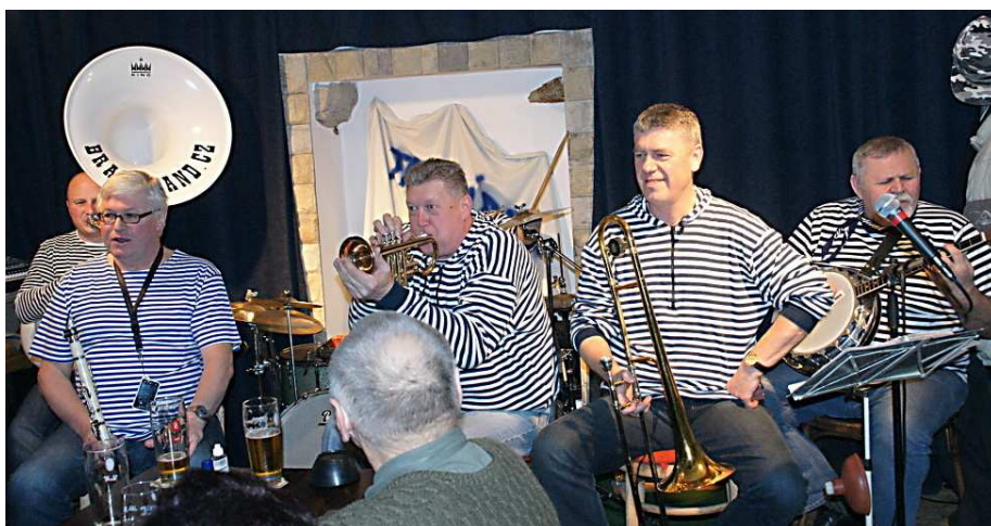
18. 1. Brass Band