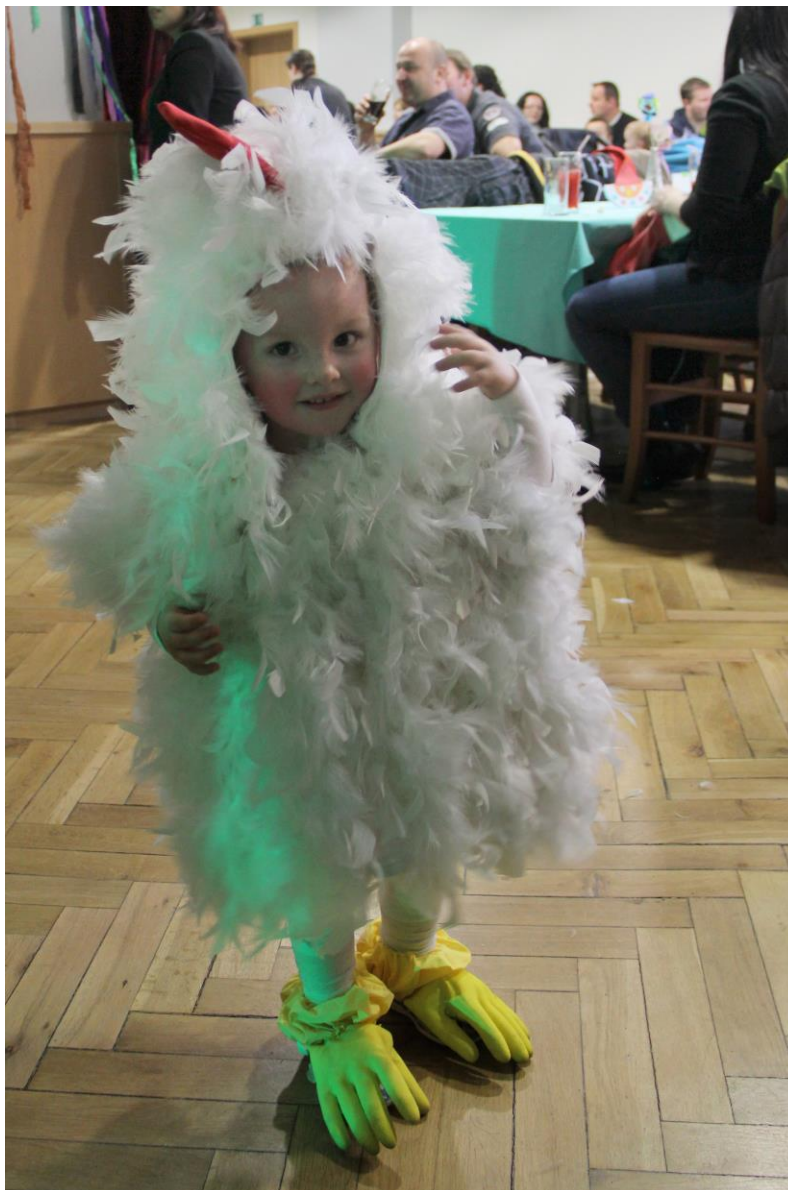
11. 2. Dětský karneval

Boříme bariéry - str. 4 | Kam zmizel zlatý poklad republiky - str. 8