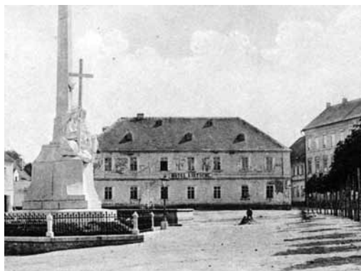
Náměstí v Jesenici s hotelem Kirtschl na počátku 20. století