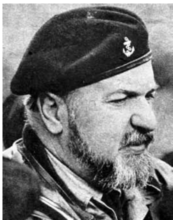
Karel Nebeský archiv rodiny Hájkovy