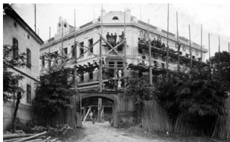
Nová školní budova krátce před dokončením

umožní čestně obstát v životě i ve světě, a tak nejlépe zhodnotí zásluhu svých rodičů, jejichž obětavosti a porozumění vděčí za svou novou, krásnou školu. Hrubá stavba nové školní budovy byla dokončena v létě roku 1904, slavnostní vysvěcení se konalo 23. 10. 1904. Budova, jejíž fasádu ozdobily vedle znaku města i císařské iniciály a výstižné štukové medailony s alegoriemi moudrosti (sova) či pilnosti (včelí úl) splňovala všechny požadavky moderní školy. Uvnitř