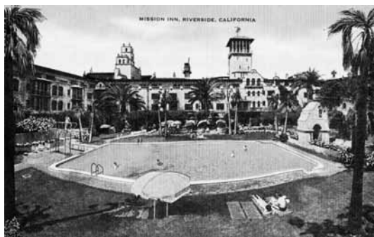
Hotel Mission Inn v Riverside v Kalifornii dobová pohlednice