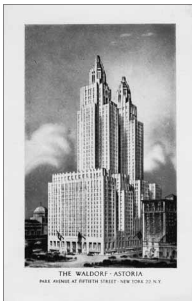
Hotel Waldorf-Astoria v New Yorku dobová pohlednice