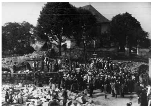
Položení základního kamene nové školní budovy 23. 9. 1903