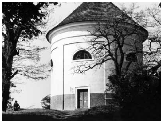
Kaple Všech svatých, asi 40. léta 20. století

zámek, dnes známý jako Humprecht, budoval i další zámky a hospodářské budovy, na svém panství v Kosmonosech nechal postavit i kostel. Tato Humprechtova činnost se projevila i na panství Petrohrad. Dobudoval rotundovou kapli na Zámeckém vrchu nad petrohradským zámkem a na základě závěti Heřmana Černína vybudoval v roce 1652 v blízkosti zámku kapli Nejsvětější trojice. U kaple založil špitál. Jeptišky zde pečovaly o ty, kteří zestárlí v hraběcích službách. Jejich ubytování, stravování