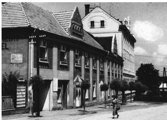
Hotel a kavárna Worschech před rokem 1945 Heimatstube Podersam-Jechnitz