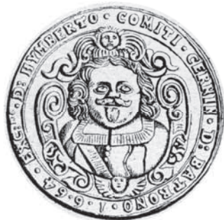
Kresba medaile s portrétem Humprechta Černína

Hrabě Humprecht Jan vykonával během svého života řadu úřadů v císařských službách a byl i osobní důvěrníkem císaře Leopolda I. Psal i poezii, založil Černínskou sbírku obrazů, nechal v Praze vybudovat mohutný Černínský palác (dnes sídlo ministerstva zahraničních věcí), podporoval rozvoj české myslivosti, zajímal se o hudbu a divadlo. Pro svoji manželku postavil v roce 1666 u Sobotky pohodlný