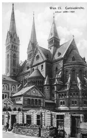
Kostel sv. Canisia ve Vídni