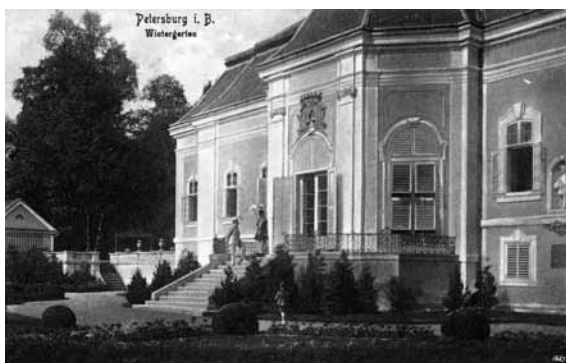
Zimní zahrada přistavěná k zámku Petrohradu po ničivém požáru v roce 1915