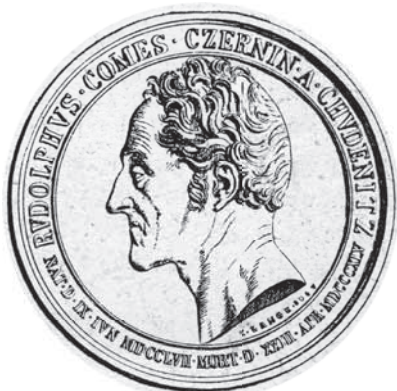
Kresba medaile s portrétem Jana Rudolfa Černína reprodukce z časopisu Český svět (1918)

Jan Rudolf Černín zemřel 23. dubna 1845 ve svém rodném městě, ve Vídni.