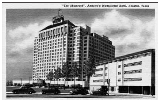
Hotel Shamrock v Houstonu dobová pohlednice